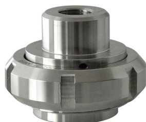
Ensemble SMS 1145

CITEC réalise le montage de tous les types de séparateurs sur manomètres, pressostats et transmetteurs de pression.