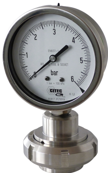
Manomètre sur séparateur

Le séparateur inox comporte principalement la membrane soudée sur le raccord SMS que nous appellerons "Flasque supérieur", ou est monté le manomètre. Il peut être fourni avec l'embout à souder sur la tuyauterie et l'écrou pour maintenir l'ensemble. L'accouplement rapide avec la membrane affleurante soudée, permet un nettoyage aisé.