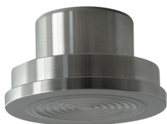
Flasque supérieur (lisse)