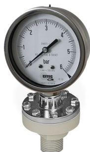
Montage manomètre 1551

CITEC réalise le montage de tous les types de séparateurs sur manomètres, pressostats et transmetteurs de pression.