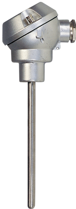
Modèle sans raccord