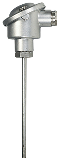
CT 2000 sans raccord

RÉFÉRENCES & OPTIONS : Voir page suivante