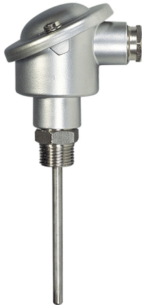
CT 2000 à visser