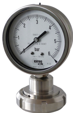
7470 + 1521 (Écrou SMS 1145)