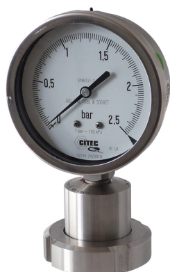
7470 + 1522 (Écrou DIN 11852)