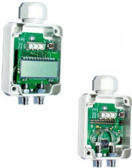
Version standard avec afficheur LCD – En option version sans afficheur (à droite)