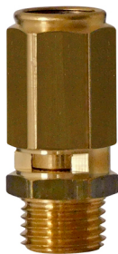
Modèle 20 G1/4"