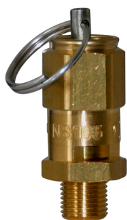
Modèle 20L G1/4"

Le modèle 20L est équipé d'un anneau permettant un test manuel.