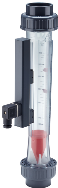
Représentation avec IDP