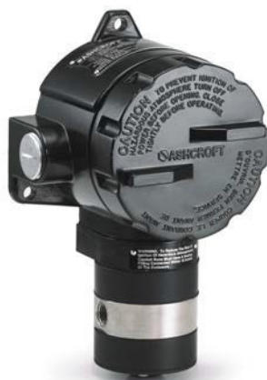
D7 Pressostat différentiel