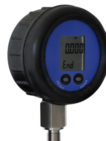
Coque de protection réf. 879 300