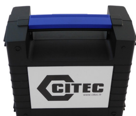
Mallette de transport

La fonction ZERO permet de définir un nouveau zéro à la pression appliquée, soit la pression atmosphérique si elle est choisie comme référence. La température est également enregistrée.