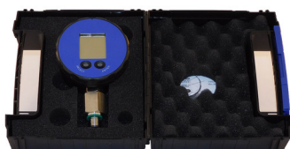
Livré avec mallette