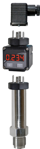
Visualisation avec l'option indicateur de boucle Loop 420

Les appareils satisfont aux exigences légales des Directives Européennes en vigueur.